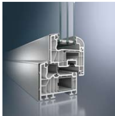
Schnitt Fenster Schüco SI 82